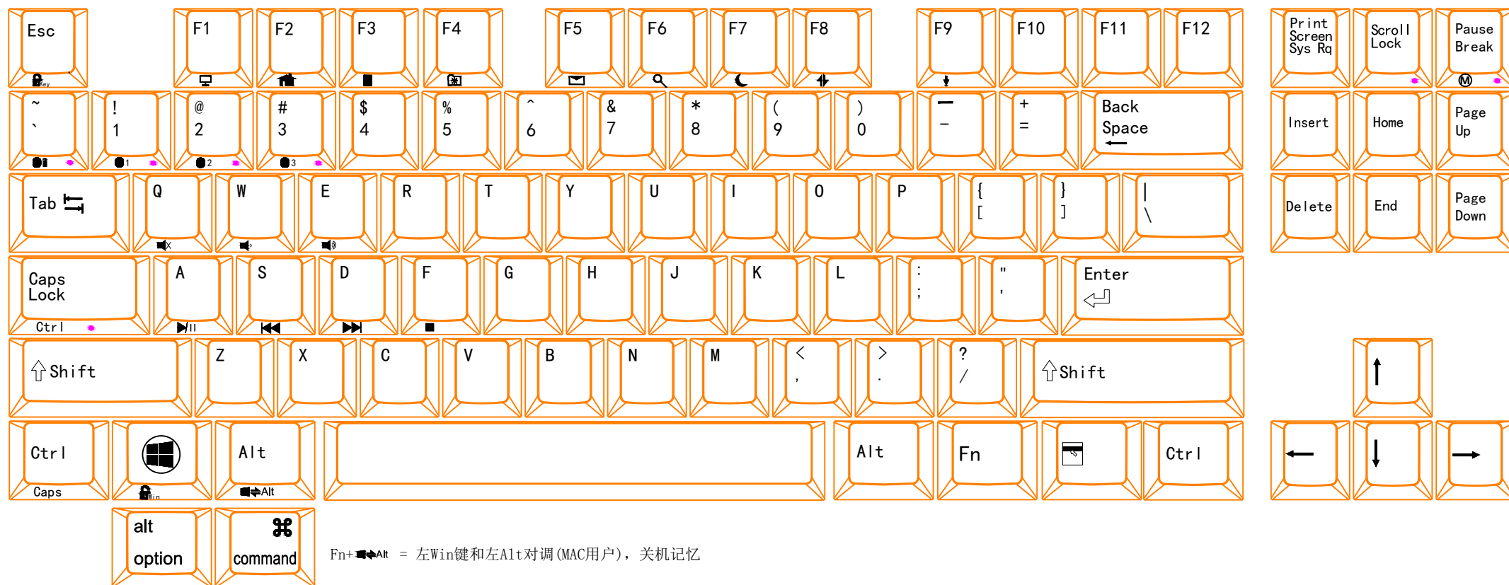
87EC(S)Pro-Ble 静电容双模可编程键盘 布局图 2017 07 21